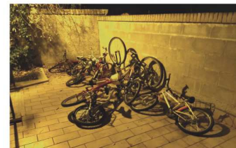
Il siciliano si è trasferito alla Bigattiera.